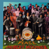
MULTI-ARTISTES Place Hubert Mounier (Stardust) 14 titres • 2019