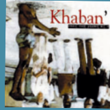
KHABAN' À la santé des fous (Autoproduit) 11 titres • 2003

Obs. : Balmino était le chanteur de ce groupe. Premier album paru après un EP nommé Tous les toits , sorti en 1999.