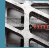
BALMINO Contresens (Samedi 14) 13 titres • 2017

Obs. : après quelques concerts tout seul, Balmino monte ce nouveau groupe en 2011 qui s'arrête en 2013.