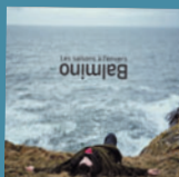
Les saisons à l'envers (EPM) 9 titres • 10/2025