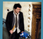
BALMINO Balmino (Samedi 14) 7 titres • 2009