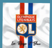
Lyonnais (Samedi 14) 1 titre • 2018

Obs. : live enregistré à la MJC du vieux Lyon.