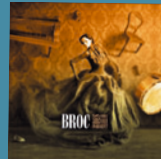
BROC Des trucs qui poussent (LMD) 10 titres • 2013

Obs. : après quelques concerts tout seul, Balmino monte ce nouveau groupe en 2011 qui s'arrête en 2013.