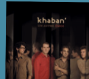
KHABAN' Un autre émoi (Autoproduit) 12 titres • 2006